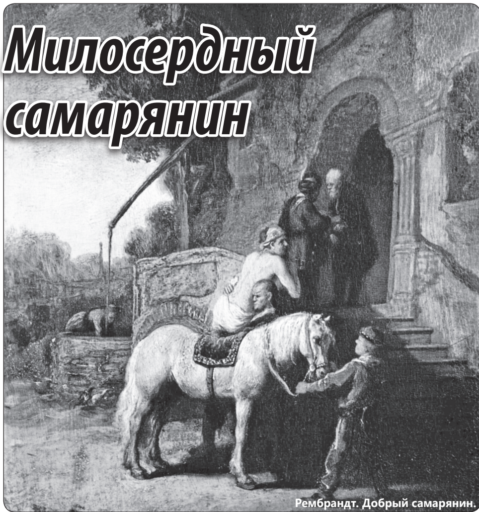
Рембрандт. Добрый самарянин.

левит. Заинтересовавшись случившимся, он остановился, разглядывая страдальца. Тот нуждался в помощи — это было очевидно, но левиту казалось неприятным возиться с истекавшим кровью человеком. Он постарался убедить себя, что это дело его не касается. Оба прохожих были служителями и считали себя толкователями Писания. Они принадлежали к классу людей, избранных быть представителями Бога среди народа. Они должны были «снисходить невежествующим и заблуждающим» (Евр. 5:2). И таким образом приводить людей к пониманию великой любви Бога к человечеству. Однако в их поступке, описанном Христом, законник не усмотрел ничего противоречащего распространенным толкованиям предписаний закона. И тогда ему был предложен другой сюжет.