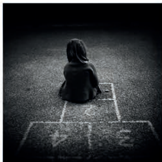
автор Николай ЗАБОЛОЦКИЙ

Среди других играющих детей Она напоминает лягушонка. Заправлена в трусы худая рубашонка, Колечки рыжеватые кудрей Рассыпаны, рот длинен, зубки кривы, Черты лица остры и некрасивы. Двум мальчуганам, сверстникам ее, Отцы купили по велосипеду. Сегодня мальчишки, не торопясь к обеду, Гоняют по двору, забывши про нее, Она ж за ними бегает по следу. Чужая радость также, как своя, Томит ее и вон из сердца рвется, И девочка ликует и смеется, Охваченная счастьем бытия. Ни тени зависти, ни умысла худого Еще не знает это существо. Ей все на свете так безмерно ново, Так живо все, что для других мертво! И не хочу я думать, наблюдая, Что будет день, когда она, рыдая, Увидит с ужасом, что посреди подруг Она всего лишь бедная дурнушка! Мне верить хочется, что сердце не игрушка, Сломать его едва ли можно вдруг! Мне верить хочется, что чистый этот пламень, Который в глубине ее горит, Всю боль свою один переболит И перетопит самый тяжкий камень! И пусть черты ее нехороши И нечем ей прельстить воображенье – Младенческая грация души Уже сквозит в любом ее движении. А если это так, то что есть красота И почему ее обожествляют люди? Сосуд она, в котором пустота, Или огонь, мерцающий в сосуде?