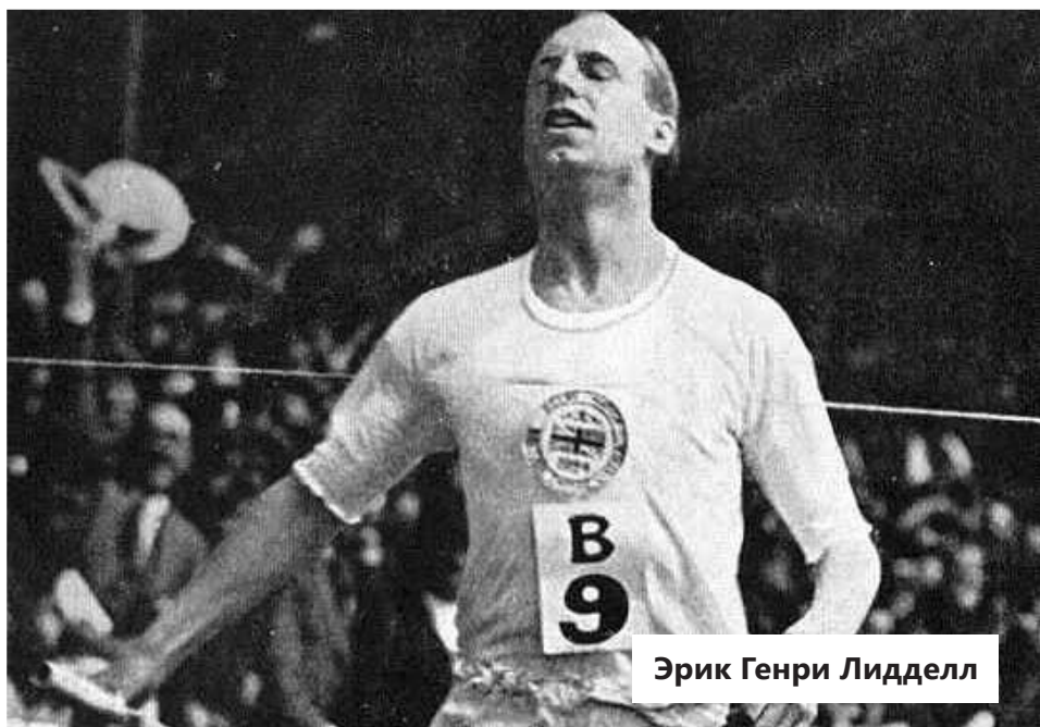
Эрик Генри Лидделл