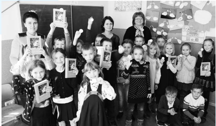
Учні школи «Живе Слово» зі своїми вчителями

Заходжу до класу і бачу 16 пар дитячих очей. І коли світло їхніх зіниць досягає моїх очей, тоді навколишній світ з його турботами та негараздами перестає для мене існувати. Щиро вдячна нашому Господу за надану можливість працювати в християнській школі, про яку ми з чоловіком почали мріяти ще 1996 року, коли віддали свої серця Богові, уклавши з Ним завіт через водне хрещення. Також дякуємо Богу за те, що хоча б наша третя дитина змогла навчатися в цій школі!