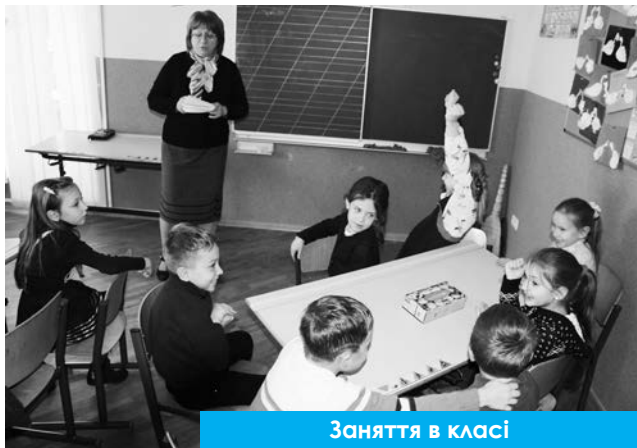
Заняття в класі

Наша донька стала однією з трьох першокласників школи «Живе Слово» у Львові. Завжди зі сльозами радості пригадую той час, коли щоранку на уроці Біблії троє дітей просили Бога: «Дорогий Ісусе, зроби, щоб наша школа стала більшою і щоб до нас прийшло багато дітей!» І які вони були щасливі, що Господь відповів на молитви, коли керівництво Західної конференції вирішило віддати під початкову школу своє офісне приміщення. Цього навчального року ми вже маємо 67 дітей у восьми класах: з 1-го по 8-й клас. Звичайно, протягом перших років існування було багато «терну і колючок» на дорозі, але «Живе Слово» продовжує діяти і розвиватися завдяки люблячому і милосердному Богові!