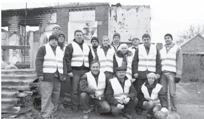
Участники проекта «Восточный ангел»