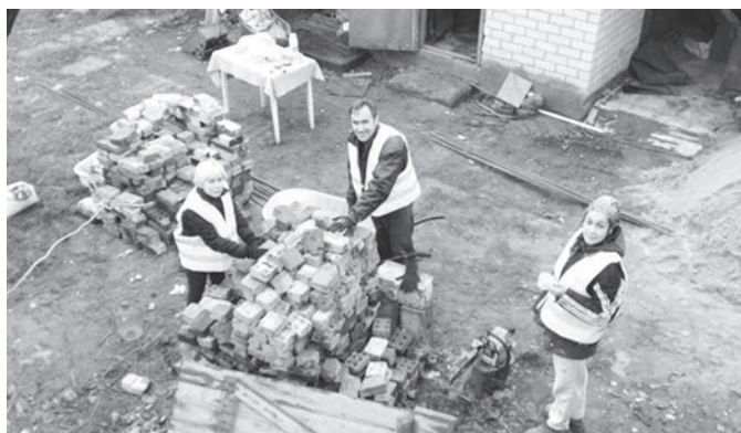
Волонтеры отстраивают разрушенный дом

«Если люди не научатся помогать друг другу, то род человеческий исчезнет с лица земли», – говорил Вальтер Скотт. Господь в Своем Слове часто указывает на необходимость помогать нуждающимся. Например, Он говорит об этом в евангельской притче о самарянине, который помог путнику, пострадавшему от разбойников.