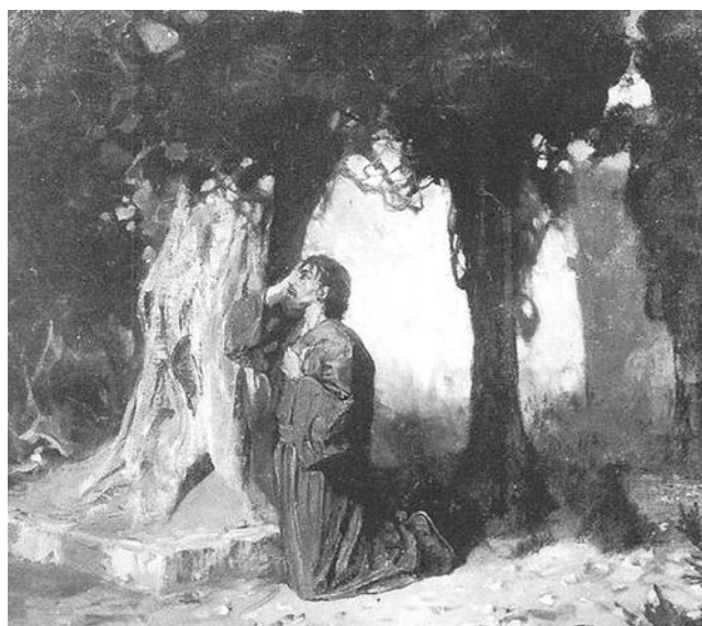
Христос в Гефсиманском саду. В. Д. Поленов

вся его изысканной красотой и славой, у них бы не возникло ни малейшего осознания того, какой дорогой ценой было куплено для них это наследство. Они бы никогда не уразумели несравненной глубины любви Спасителя. Они не пили из чаши и не прошли крещения. Небо осквернилось бы, если бы такие люди там жили. Только участвующие в страданиях Сына Божьего, пришедшие от великой скорби и омывшие и убелившие свои одежды в крови Агнца смогут наслаждаться неопишуемой славой и непревзойденной красотой Неба...»