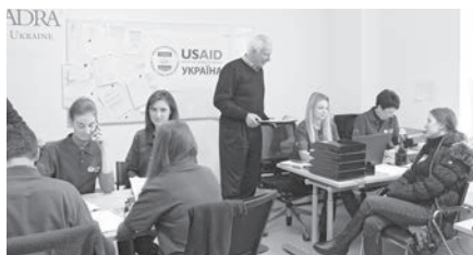
Директор АДРА с волонтерами

В Центре поддержки семьи и детей постоянно работали и продолжают работать психологи, помогающие переселенцам адаптироваться к новым условиям. Психологическую помощь уже получили 1 873 человека. Существует особая программа и для детей. В ней участвует Дарницкая социальная служба, которая направляет семьи в Центр поддержки. Каждый день после школы, кроме пятницы и субботы, дети занимаются там в разных кружках. В Центре поддержки семьи и детей также работают детский психолог, реабилитолог, логопед. С родителями регулярно проводит беседы психолог-консультант по воспитанию детей. Родители, посещая эти встречи, также получают необходимые наборы на всю семью.