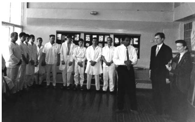
Кандидаты на водное крещение, г.Ингулец