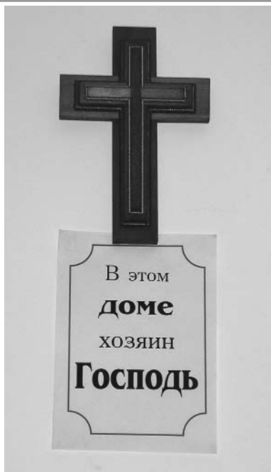
В молитвенной комнате колонии