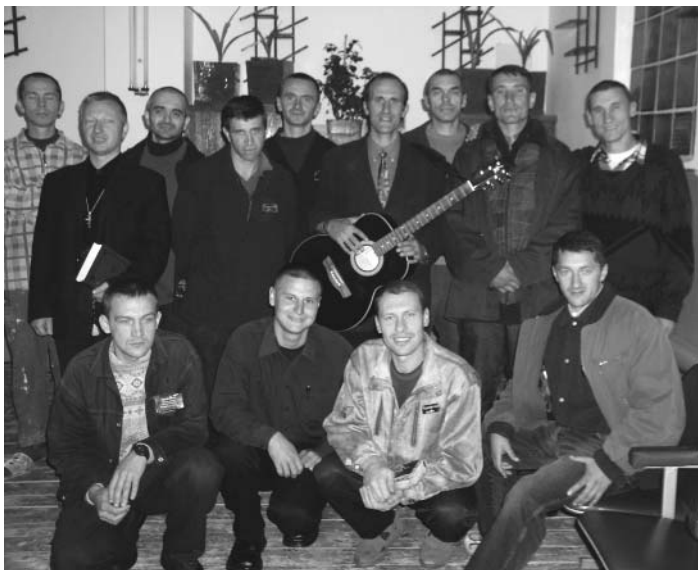
Служение в Бучанской исправительной колонии (БИК)