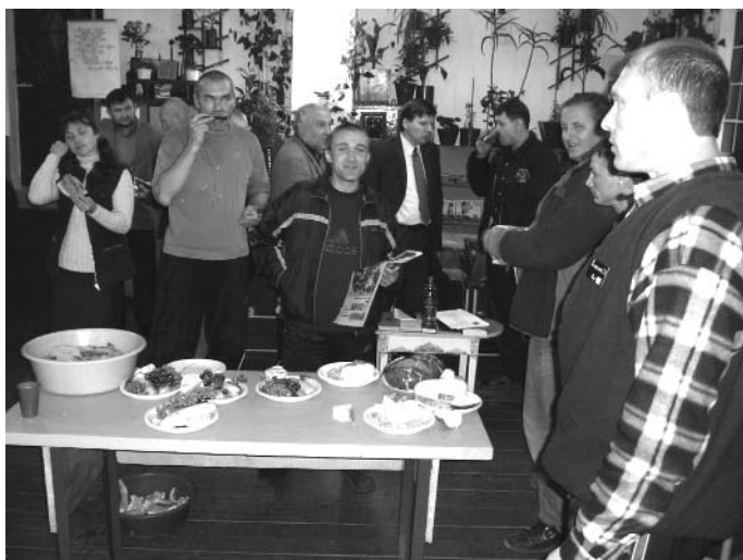
Праздник жатвы в БИК