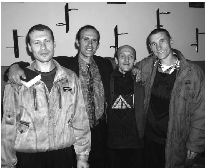
Группа верующих в БИК-85