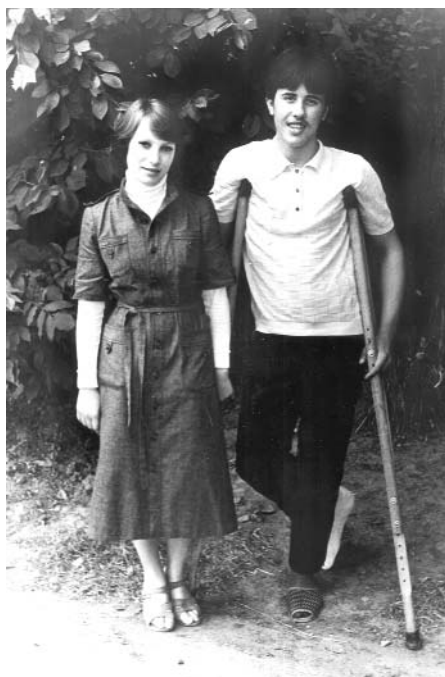
После травмы, 1980 г.