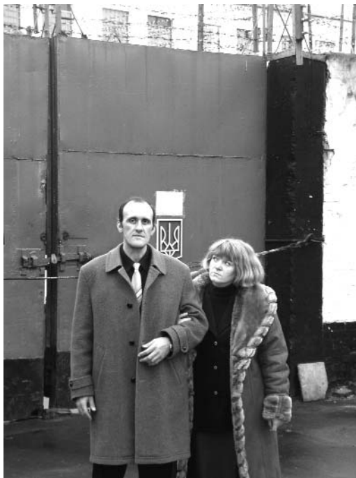
У ворот БИК-85