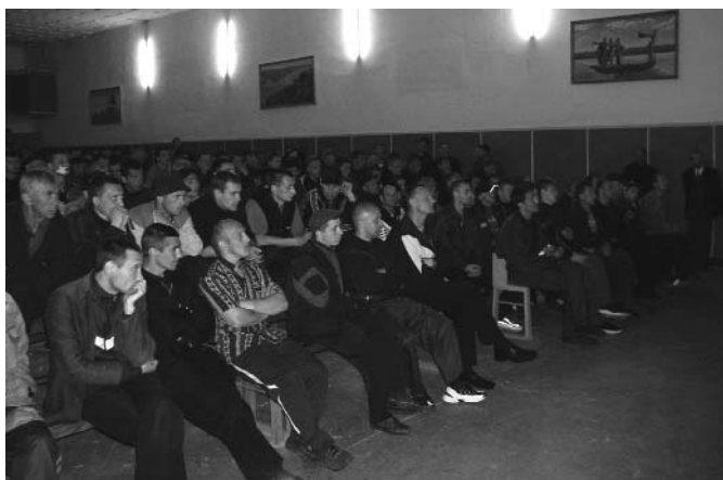
Служение в БИК